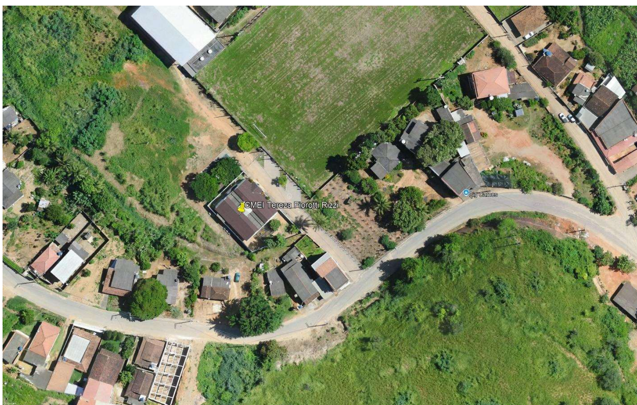
CMEI Tereza Fiorotti Rizzi (301386.47 m E / 7797940.40 m S)