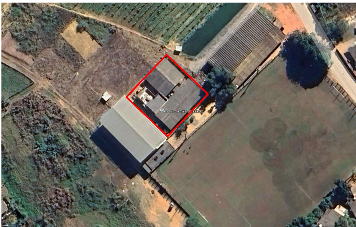
EMEIEF Baixo Sossego (301374.38 m E / 7798026.32 m S)