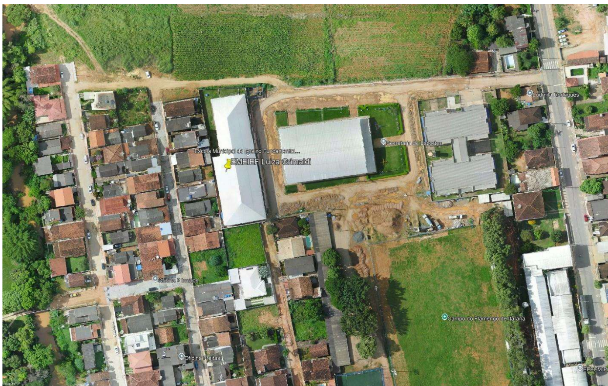
EMEIEF Luiza Grimaldi (303473.48 m E / 7801964.09 m S)