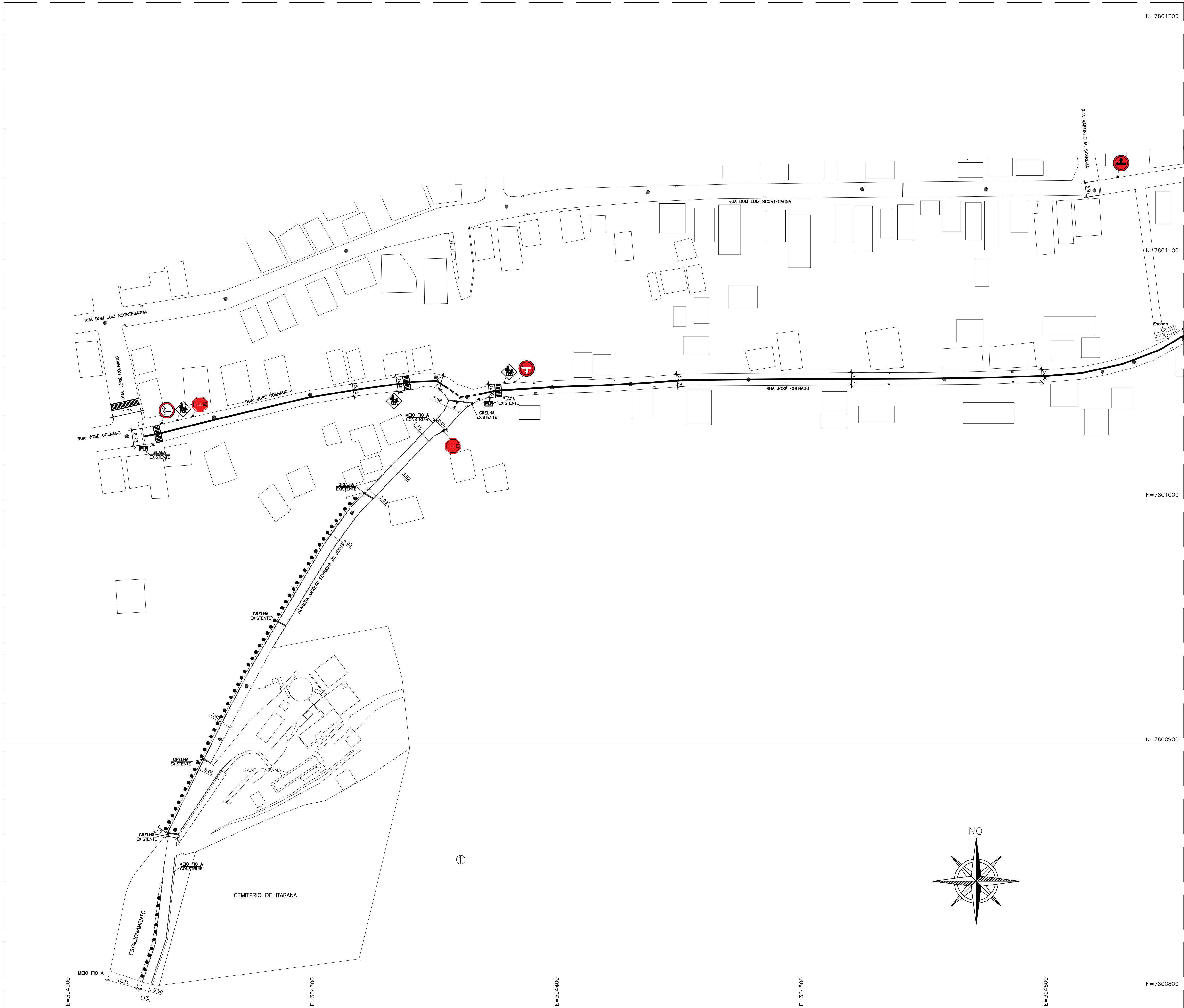
PROJETO SINALIZAÇÃO ESC.: 1/750