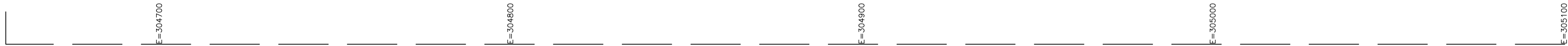
PROJETO CALÇADA CIDADÃ ESC.: 1/750