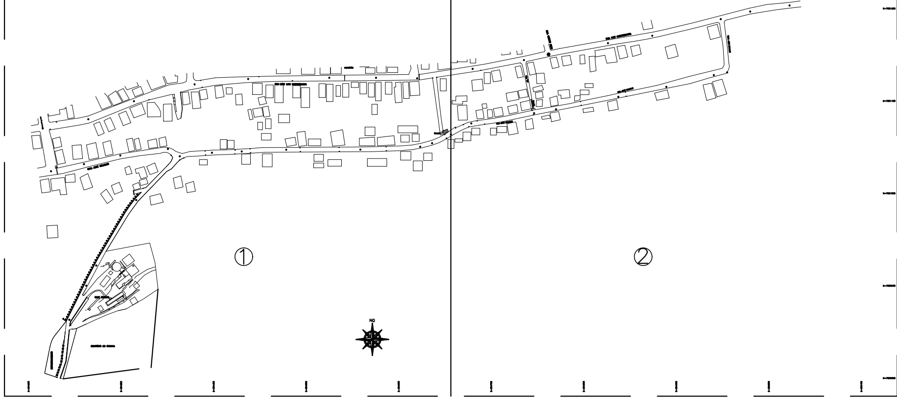
ARTICULAÇÃO DAS PRANCHAS ESC.: 1/4000