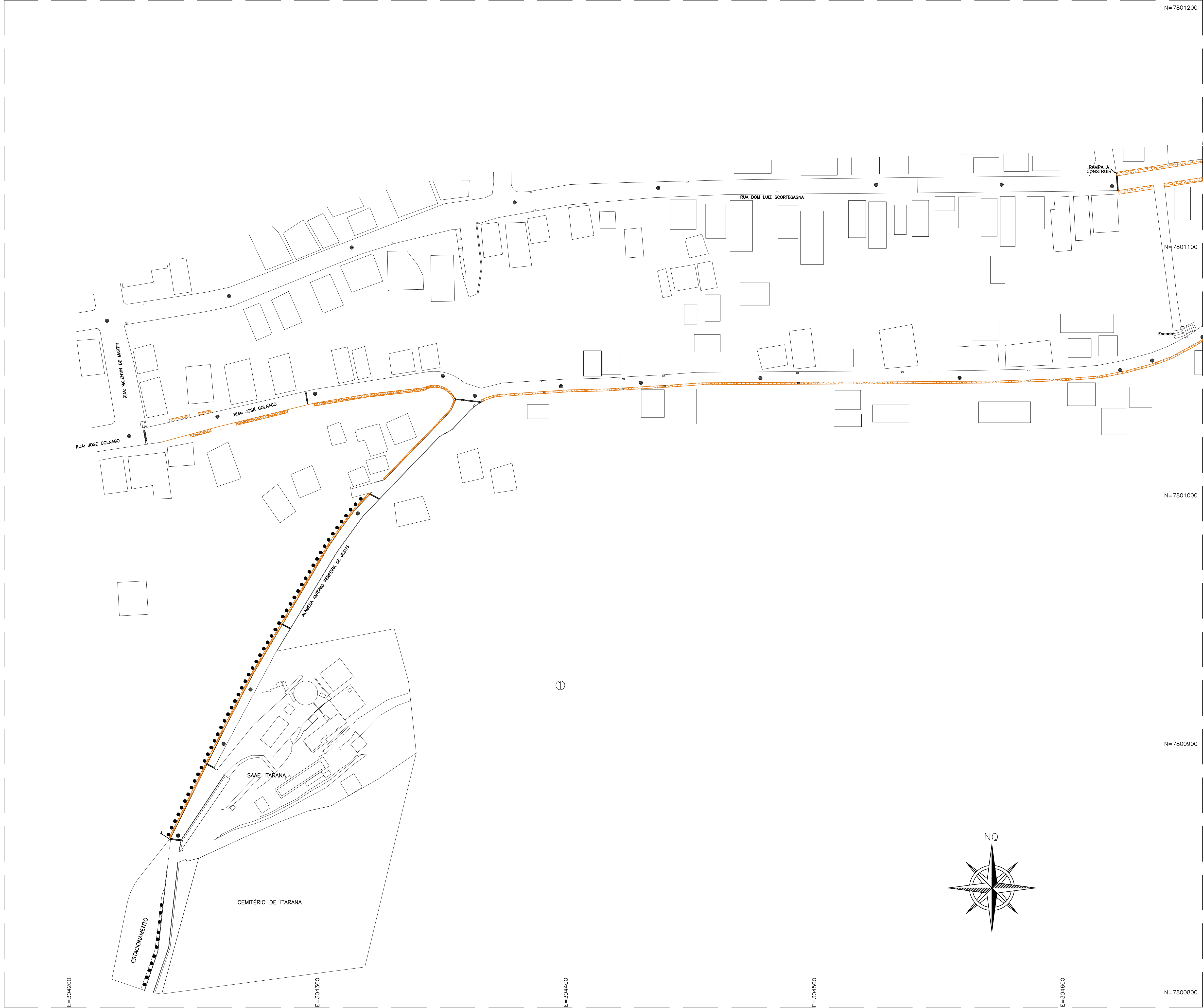
PROJETO CALÇADA CIDADÃ ESC.: 1/750