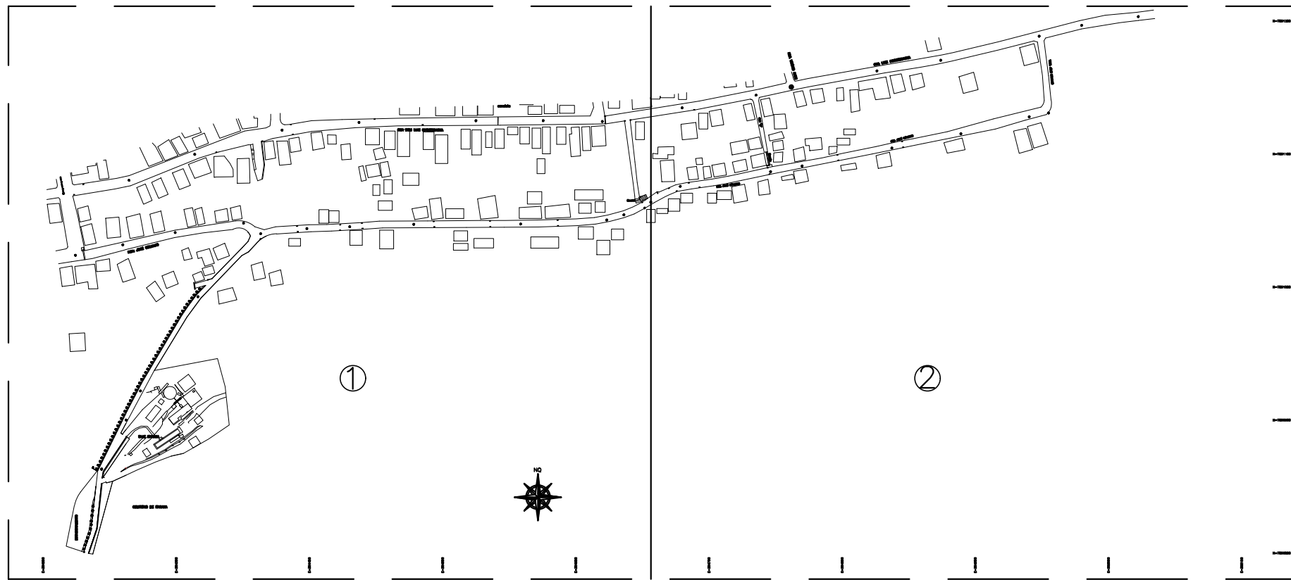
ARTICULAÇÃO DAS PRANCHAS ESC.: 1/4000