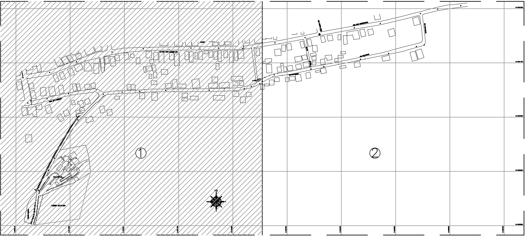
ARTICULAÇÃO DAS PRANCHAS ESC.: 1/4000